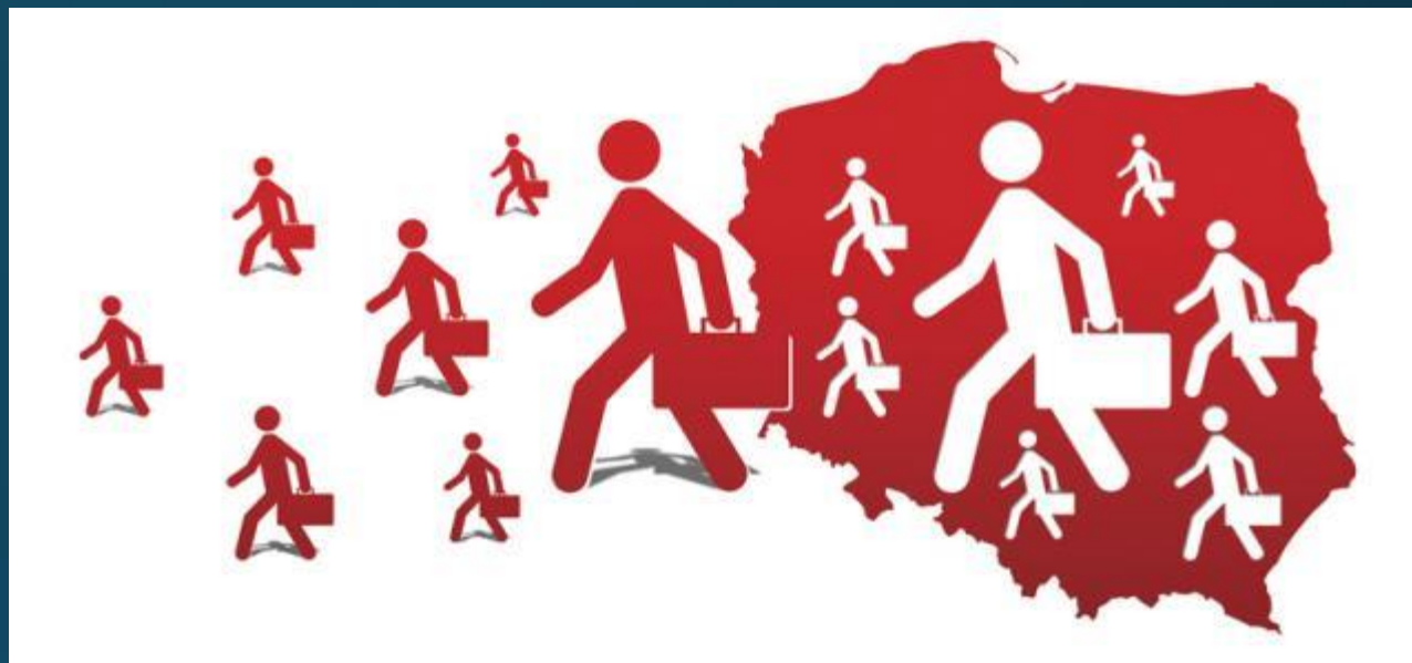
Tablica 1. Szacunek emigracji z Polski na pobyt czasowy w latach 2004-2020 a (liczba osób przebywających za granicą w końcu roku)

Hlavní příčinou neúspěchu je pracovní migrace mladých Poláků v rámci EU a světa